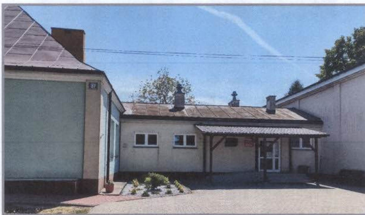
Szkoła Podstawowa im. mjr. Henryka Dobrzańskiego „Hubala” w Przydworzycach