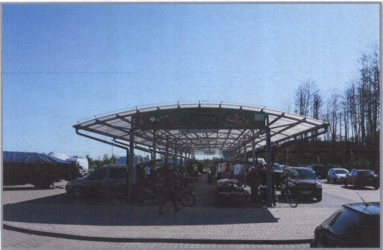
Targowisko „Mój Rynek” w Magnuszewie