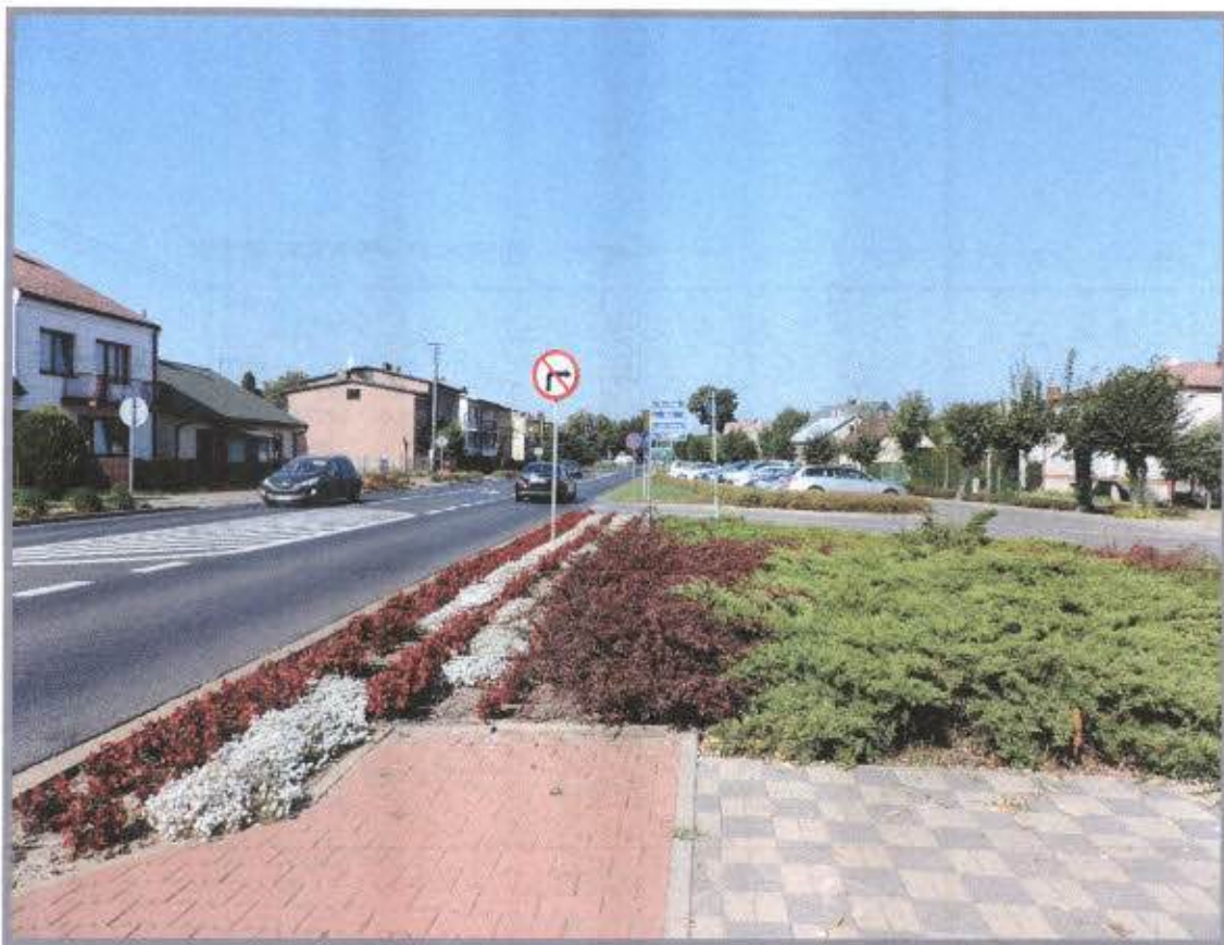
Główna ulica w Magnuszewie