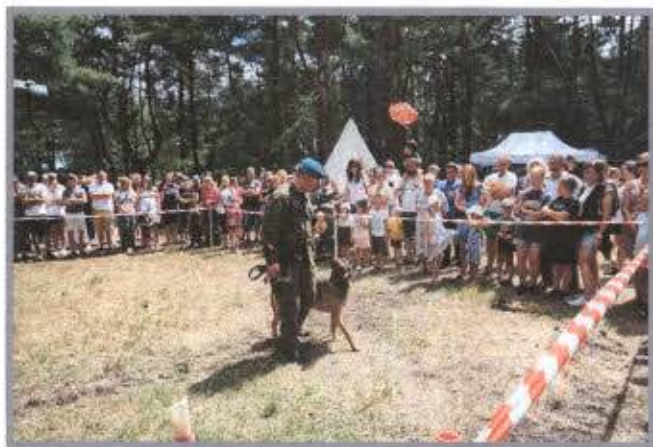
VII Piknik Militarny

Corocznie w Skansenie, z okazji obchodów Narodowego Święta Niepodległości, organizowany jest Przegląd Pieśni i Poezji Patriotycznej dla dzieci i młodzieży.