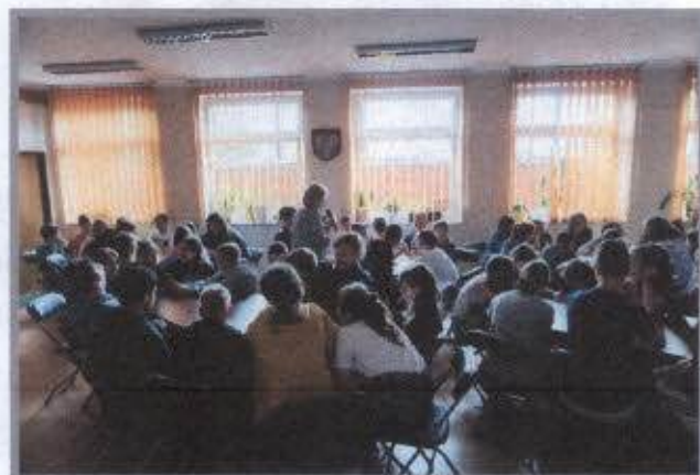
Diagnoz potrzeb społeczności lokalnej z młodzieżą z ZSiPO w Magnuszewie