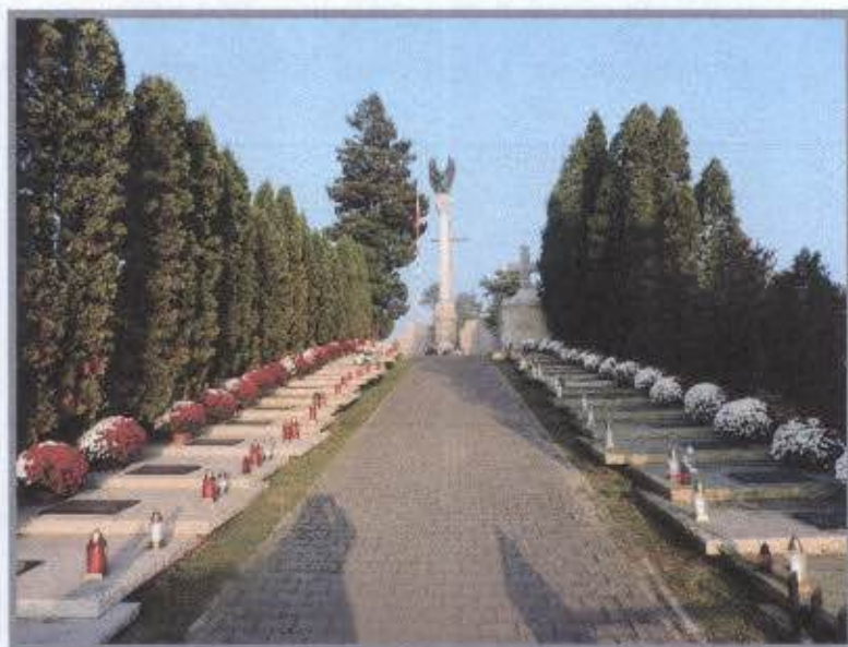
Kwaterna poległych Żołnierzy na Cmentarzu Parafialnym w Magnuszewie