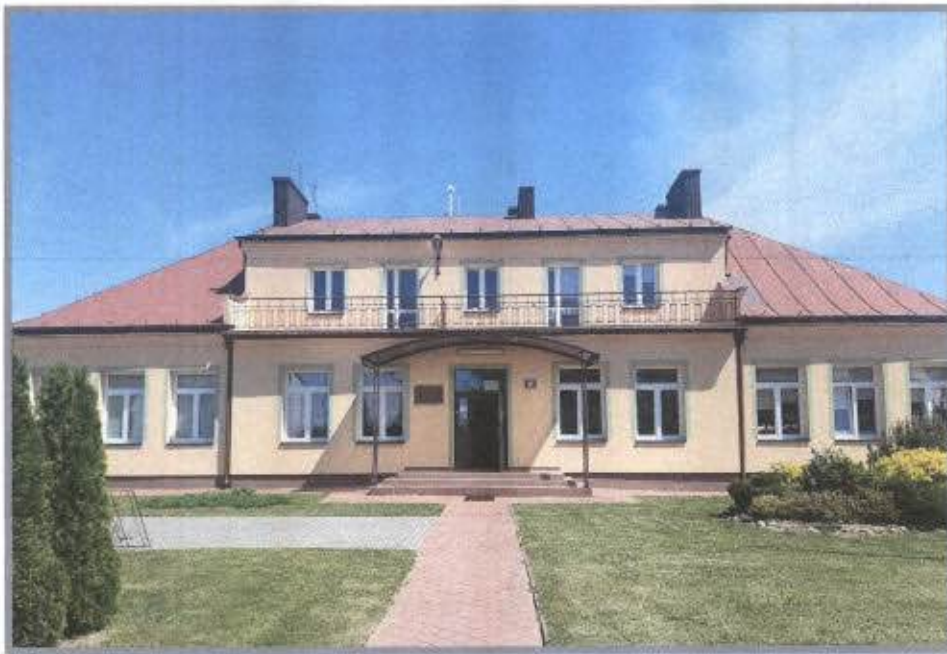
Szkoła Podstawowa im. Żołnierzy Polskich spod Monte Cassino w Mniszewie

W 2022 r. na terenie gminy Magnuszew funkcjonowało 5 placówek oświatowych dla 571 uczniów tj.: