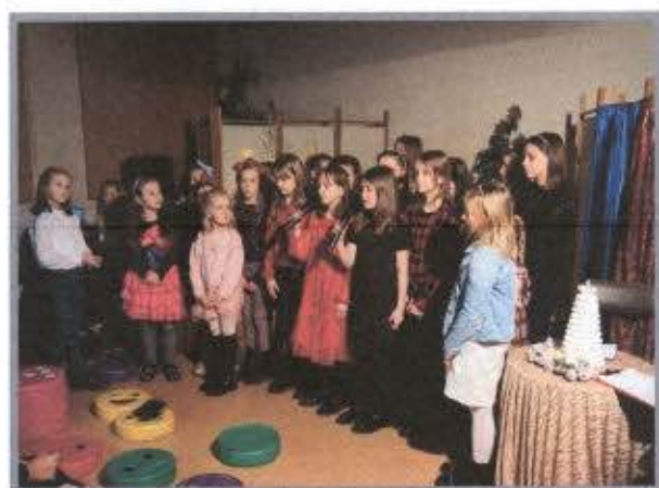
Koncert Bożonarodzeniowy w wykonaniu uczestników warsztatów muzycznych