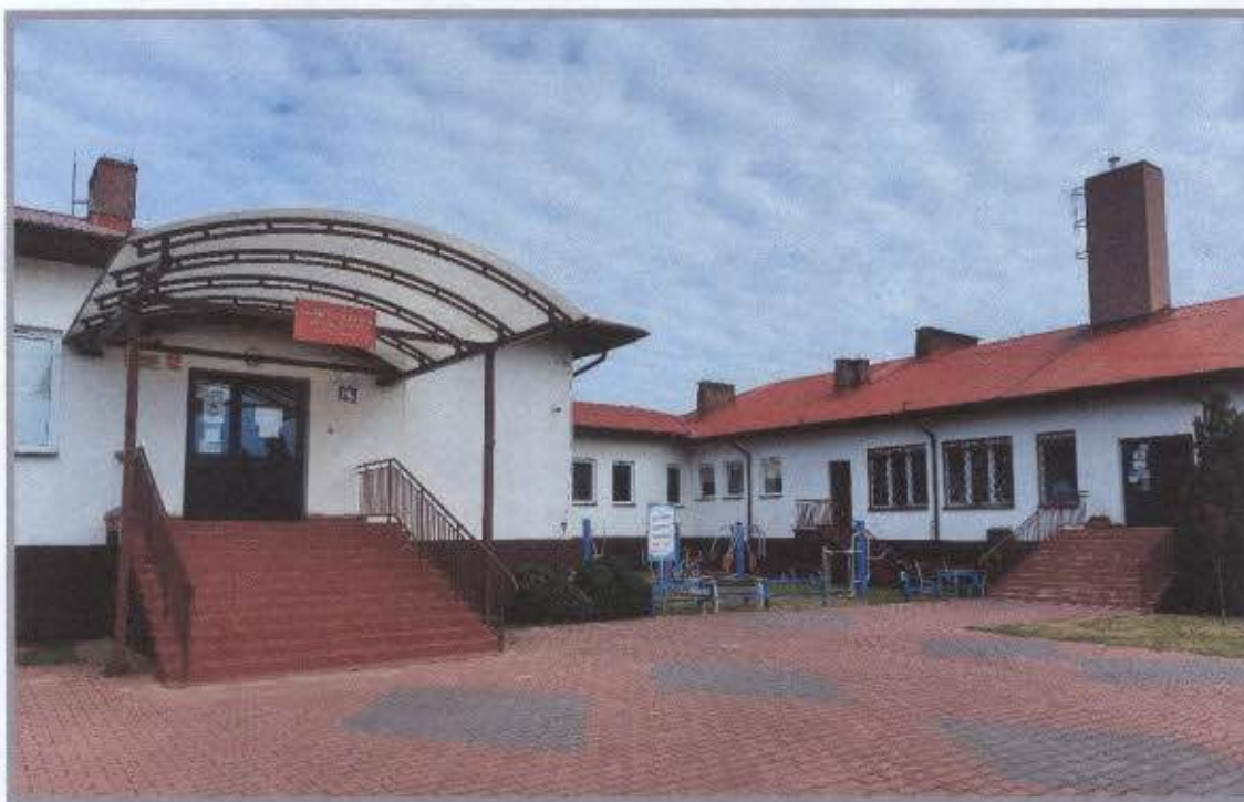
Szkoła Podstawowa im. Jana Pawła II w Chmielewie