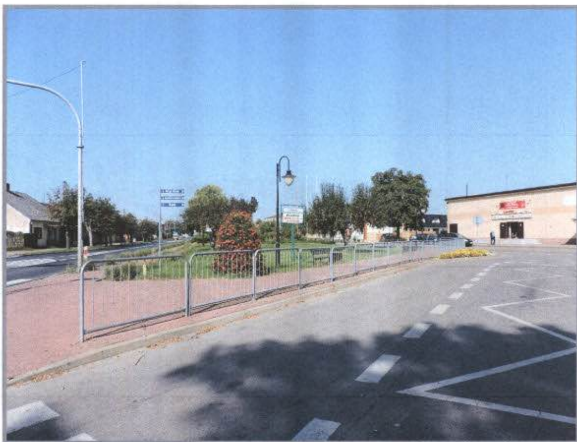
Strażnica OSP w Magnuszewie