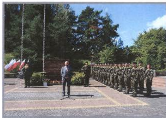
VII Spotkanie na Przyczółku