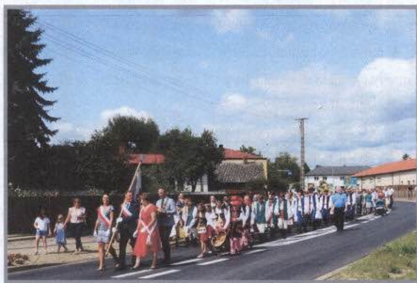
Dożynki Gminne 2022