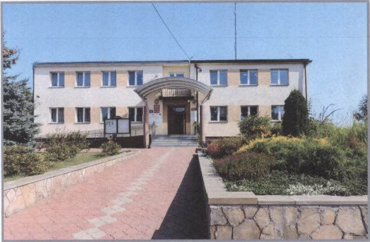
Budynek Urzędu Gminy w Magnuszewie