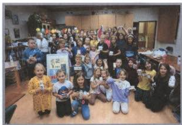
Warsztaty decoupage podczas Nocy Bibliotek