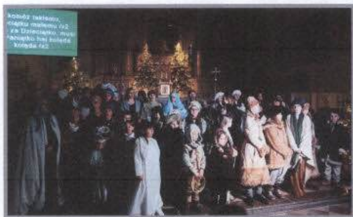
III Magnuszewski Orszak Trzech Króli

Działalność Gminnej Biblioteki Publicznej – Centrum Kultury w Magnuszewie obrazują poniższe zdjęcia: