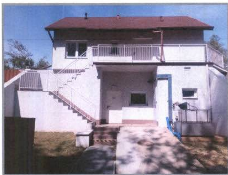
Oczyszczalnia ścieków w Magnuszewie

Roczne wydobycie wody ze wszystkich ujęć doprowadzających wodę do SUW wyniosło w 2021 roku - 274 tys. m 3 . Każda ze stacji uzdatniania wody posiada 2 ujęcia w postaci studni głębinowych pracujących naprzemiennie. Dzięki takiemu rozwiązaniu sieć wodociągowa gminy zabezpieczona jest na wypadek awarii lub potrzeby konserwacji jednego z ujęć. Ogólny stan techniczny sieci wodociągowej jest dobry.