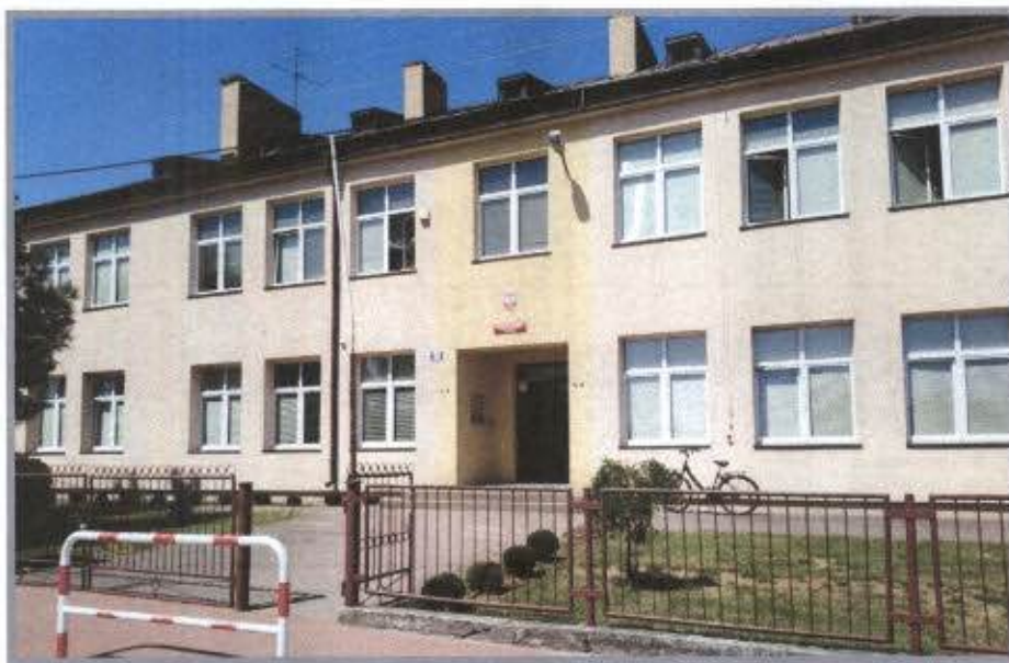
Szkoła Podstawowa im. Stefana Czarnieckiego w Rozniszewie