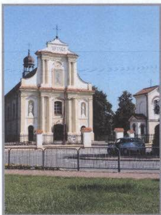
Kościół Parafialny pw. Św. Jana Chrzciciela w Magnuszewie

Centrum miejscowości nosi cechy charakterystyczne dla przestrzeni miejskich: parkingi, ciągi komunikacyjne i piesze, oświetlenie ulic, instytucje miastotwórcze, miejsca pamięci, targowisko oraz rynek. Z całą pewnością należy stwierdzić, iż ukształtowane centrum, zwarta zabudowa, a także instytucje użyteczności publicznej wskazują na miejski charakter miejscowości.