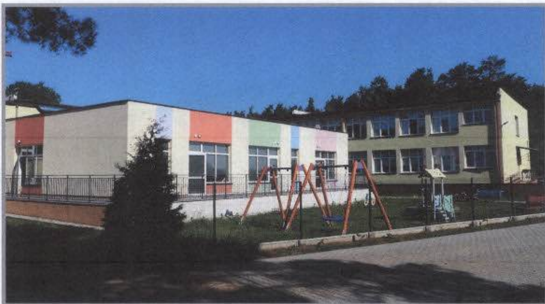
Żłobek „Magus” w Magnuszewie

życia w dni robocze w godzinach 6.30-16.30 z możliwością wydłużenia czasu ich pobytu. Zapisy trwają cały rok.